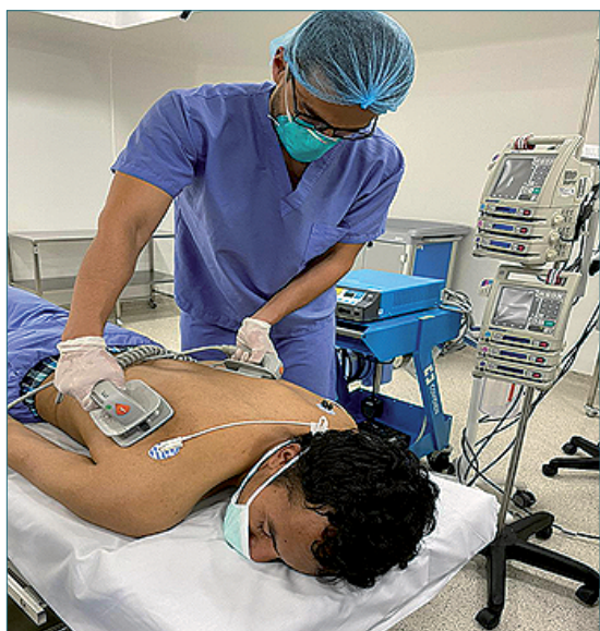
Figura 4. Desfibrilación en posición prona.

evaluar el ritmo cardiaco con ECG y el gasto cardiaco de manera indirecta, a través de la capnografía. Para discontinuar o suspender las maniobras se deben aplicar los lineamientos actuales de RCP (ILCOR/AHA/ Reino Unido).